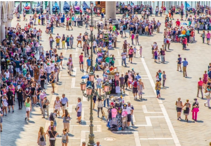
Turisti a Venezia